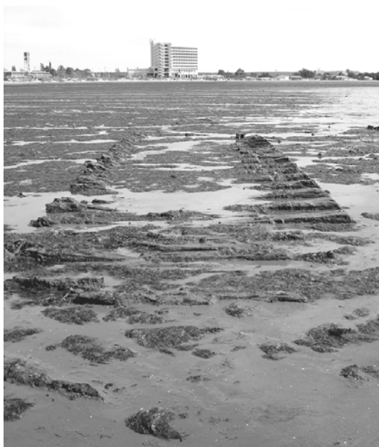
Figura 4. Vista de los restos estructurales de madera del sitio Bahía Galenses 2 (BG2), Puerto Madryn (Provincia de Chubut) (N. Ciarlo 2006).

Durante los últimos dos años se realizaron trabajos de relevamiento, excavación y protección del sitio Bahía Galenses 2 (BG2) (Figura 4). Sobre la base de los estudios de la estructura excavada y del análisis de los materiales se pudo determinar que se trata de los restos de una embarcación de madera de entre 300 y 500 toneladas de desplazamiento, construida durante el siglo XIX —siendo por el momento el pecio más antiguo hallado en la zona de Puerto Madryn— y que habría naufragado presumiblemente a causa de un incendio (Murray et al. , 2008).