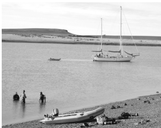
Figura 3. Actividades de prospección de la ría frente al sitio Hoon : sistema de remolque de los equipos geofísicos (en este caso magnetómetro) y grupo de buzos encargados de los relevamientos subacuáticos (C. Murray 2005).

les de restos de artefactos soterrados (Vainstub y Murray 2006). En 2005 se prospectó el lecho de la ría con equipo de sensoramiento remoto (sonar de barrido lateral, ecosonda de simple haz y magnetómetro), operaciones complementadas con buceos en los sitios previamente delimitados (Figura 3) (Murray et al. , 2007).