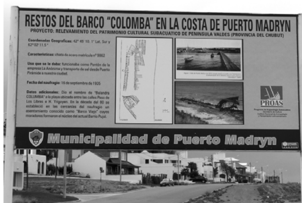
Figura 5. Cartel interpretativo de la balandra Colomba —con datos sobre la embarcación y un plano del relevamiento— ubicado en inmediaciones del sitio donde se encuentra el naufragio, Puerto Madryn (Provincia de Chubut) (R. Bastida 2008).