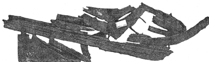
Figura 1. Restos pertenecientes al codaste y maderamen de una de las embarcaciones recuperadas a fines del siglo XIX en la zona del actual Puerto Madero (1984, Registro de Objetos Históricos, núm. 51, Museo Histórico Nacional, Buenos Aires).